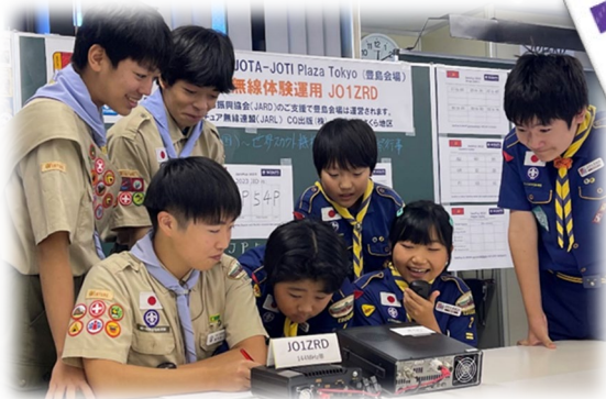
モールス講習 送受信・打鍵