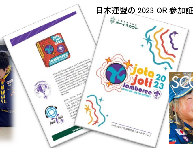
日本連盟の 2023 QR 参加証